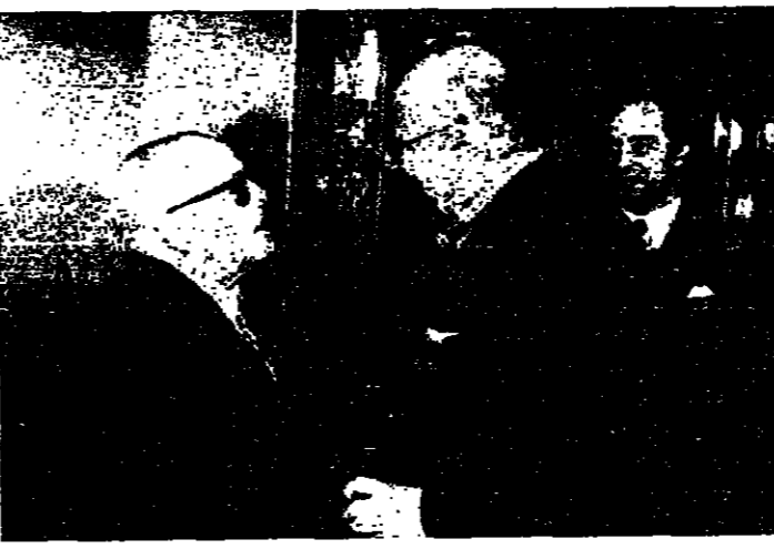
بورقيبة يرحب بسبادوليني

الانوار في لبنان: ٦٠٠ ليل في بيروت: ٨٠٠ ليل في طرابلس: ٧٠٠ ليل في صور: ٦٠٠ ليل في النبطية: ٦٠٠ ليل في زحلة: ٦٠٠ ليل في البعلبعل: ٦٠٠ ليل في طبريا: ٦٠٠ ليل في حاصبيا: ٦٠٠ ليل في راشيا: ٦٠٠ ليل في الكسروانية: ٦٠٠ ليل في عكا: ٦٠٠ ليل في حيفا: ٦٠٠ ليل في الناصرة: ٦٠٠ ليل